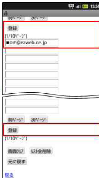
受信したいアドレスを入力して [登録] を選択