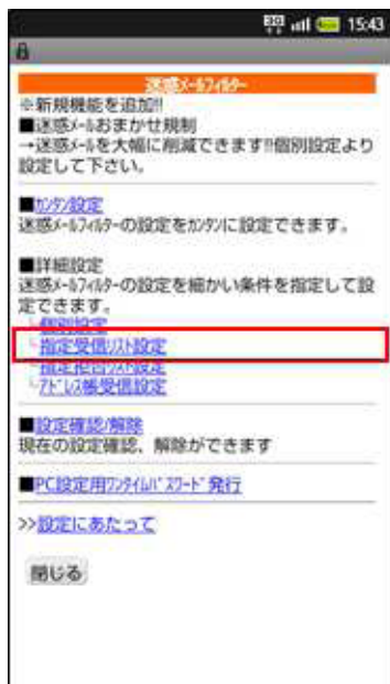
[指定受信リスト設定] を選択